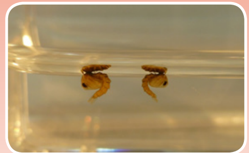
Crisálidas en el agua.