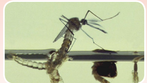
Un mosquito adulto sale de una crisálida.