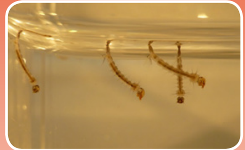
Larvas en el agua.