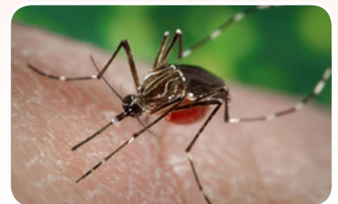
Un mosquito adulto pica a una persona.