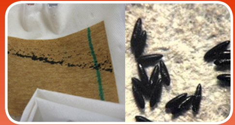
Los huevos tienen el aspecto de algo sucio negruzco.